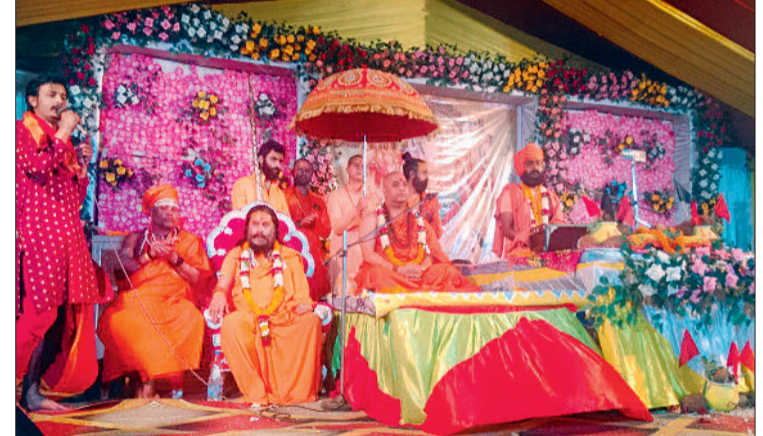
हरिभूमि न्यूज ▶ कुण्डा/कोलेगांव