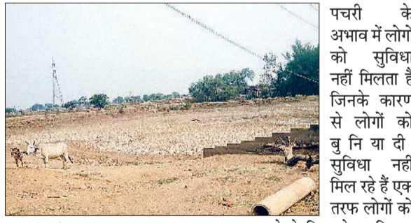
हरिभूमि न्यूज ▶ बरबसपुर

पचरी के अभाव में लोगों को सुविधा नहीं मिलता है जिनके कारण से लोगों को बु नि या दी सुविधा नहीं मिल रहे हैं एक तरफ लोगों को स्नान करने के लिए खेत खलियान जाना पड़ता है वहीं दूसरी तरफ मवेशियों को भी राहत नहीं मिल रही है बूंद बूंद पानी के लिए भटकना पड़ रहा है यदि इस तालाब में ज़िम्मेदार पानी डाल दिया जाए तो लोगों को सुविधा व मवेशियों को भी निजात मिल जायेगा। इस ओर जिम्मेदार को ध्यान देने की जरूरत है ताकि लोगो व पशु पक्षी और मवेशियों को राहत मिल सके।