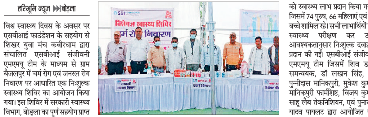
हरिभूमि न्यूज ▶ बोड़ला