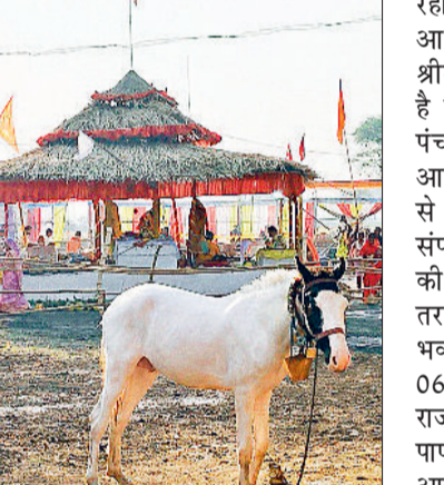
हरिभूमि न्यूज ▶ पण्डरिया