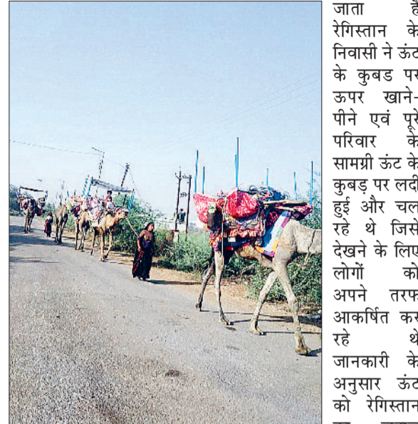
हरिभूमि न्यूज ▶ बरबसपुर

कहा जाता है क्योंकि रेगिस्तान में पाए जाने वाले परिवहन का एकमात्र साधन है इसके पीठ पर कूबड़ होता है और यह बिना पानी के सात महीना तक जीवित रह सकते हैं अपनी पीठ पर 200 किलोग्राम से अधिक वजन उठा सकते हैं ऊंट का उपयोग रेगिस्तान में परिवहन व माल ढोने के लिए किया जाता है ऊंट चार किलोमीटर के प्रति घंटा व पफतार से चल सकते हैं इनके पैर गद्दीदार जैसे होते हैं। ग्रामीण अंचलों में इन समय रेगिस्तान का जहाज कहे जाने वाले ऊंट अब ग्रामीण अंचलों के गांव और सड़क पर पैदल चलते हुए दिखाई देने लगे हैं जिसे देखकर लोग आकर्षित हो रहे हैं ये नजारा औद्योगिक क्षेत्र हरिनछपरा जाने वाले मार्ग पर आवागमन करते समय देखा गया है जिसे राजस्थान में रेगिस्तान का जहाज के नाम से ऊंट को पुकारा